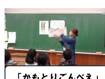
「かもとりごんべえ」