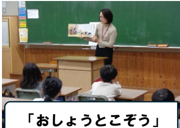
「おしょうとこぞう」