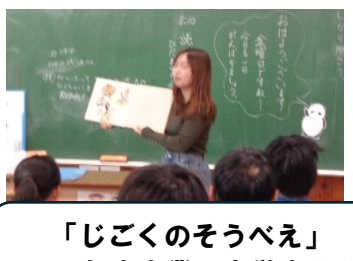
「じごくのそうべえ」 H29 年度卒業 大学生さん