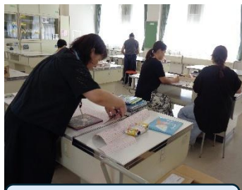
ブックカバーかけ

今年も本校の読書活動の伝統的な取組であるビブリオバトル大会が12月18日に開かれました。その読書活動を支えてくださっているのが図書ボランティアさんです。購入された本のブックカバーかけ、いのちの本棚や学年の図書コーナーの本の整頓、掲示物の作成、季節ごとの模様替えなど、子供たちが多くの本に親しむことができるように読書環境の整備をしていただいています。