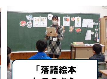
「落語絵本 ねこのさら」