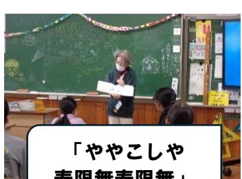
「ややこしや 寿限無寿限無」