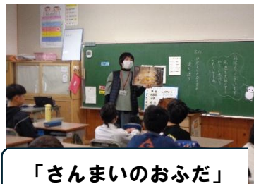
「さんまいのおふだ」