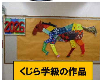
くじら学級の作品

ボランティアの皆さんが、授業での教育活動から環境整備まで、いろいろな場面で支援をしてくださることにより、府小っ子たちの学習や学校生活を充実させることができました。温かく支えていただいたことに大変感謝しております。本当にありがとうございました。どうぞよいお年をお迎えください。3学期も引き続きよろしくお願いします。