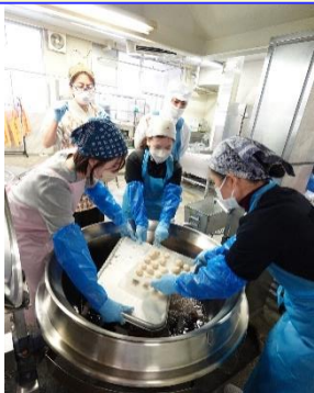
大量の揚げ物を揚げるため冬でも汗をかきます。