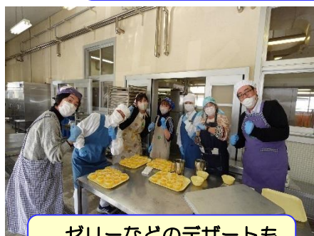
ゼリーなどのデザートも1個ずつの手作りです。