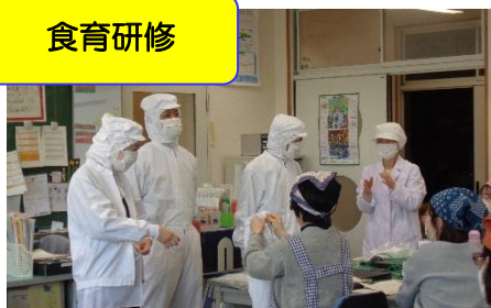
髪の毛やほこりなどが入らないように身支度をしっかり整えます。