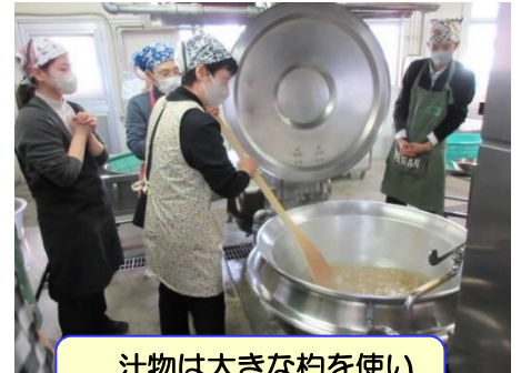
汁物は大きな杓を使いながら作ります。