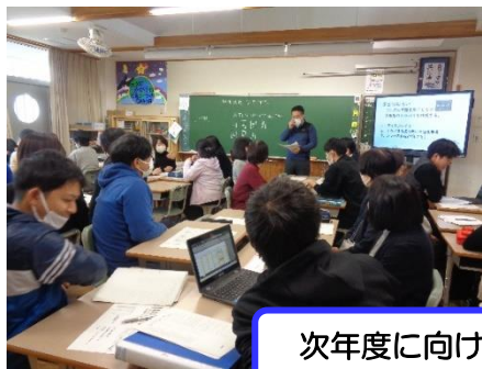
次年度に向けて 特別活動についての見直し