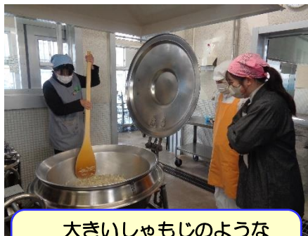
大きいしゃもじのような「スパテラ」でかき混ぜるのも力が必要な大変な作業で