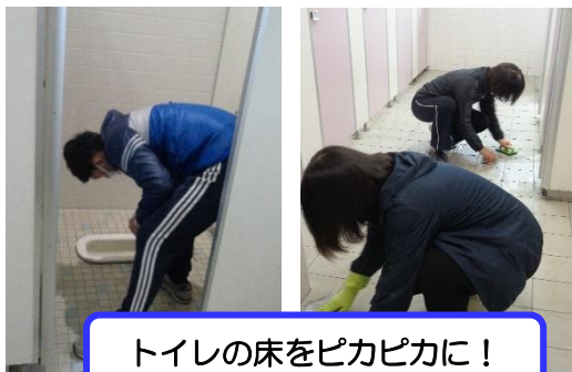
トイレの床をピカピカに！

この冬は、トイレ掃除や学年図書コーナーを整えました。また、特別活動や食育について研修も行い、冬休みを終えて登校する子供たちを迎える準備をすることができました。子どもたちも気持ちよく3学期のスタートを切ることができました。子供たちが力をつけるため、自ら学び、共に伸びていく教職員であり続けます。