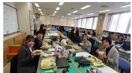
安全でおいしい給食を食べることができるよう調理員さんたちが衛生面に気を付けたり工夫したりしながら毎日作られていることが分かりました。