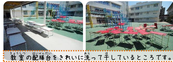
教室の配膳台をきれいに洗って干しているところです。

長かった夏休みも終わり、いよいよ2学期の給食がスタートしました。給食室では夏休みに、普段できない大掃除をしたり、食器やトレイを磨いたりして、2学期の給食を万全に始められるように準備をしていました。