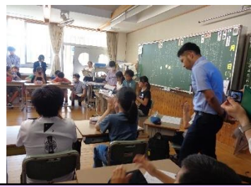
5年：特別活動「オリジナル行事をプロデュース」