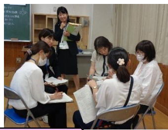
2年：算数科「3けたの数100より大きい数をしらべよう」