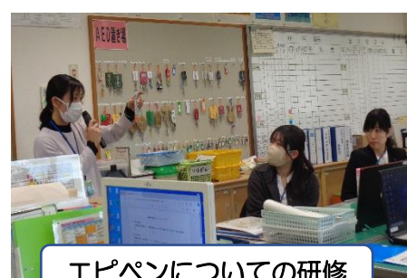
エピペンについての研修