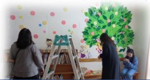
図書ボランティア