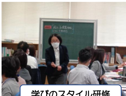
学びのスタイル研修

新しい仲間を迎えた私たち府中小学校教職員は、期待に満ちた府小っ子に会えることをとても楽しみにして、環境整備や授業の準備、教職員としての力を付ける学びに励んでいました。子供たちが「学校に行くのが楽しみ!」「今日も府中小学校に通ってよかった!」と思う学校になるように、これからも自分を磨き、学び続けていきます。