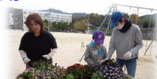
図書ボランティア