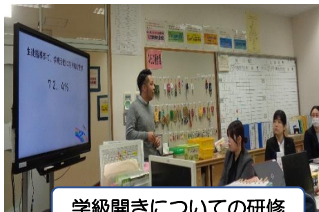
学級開きについての研修