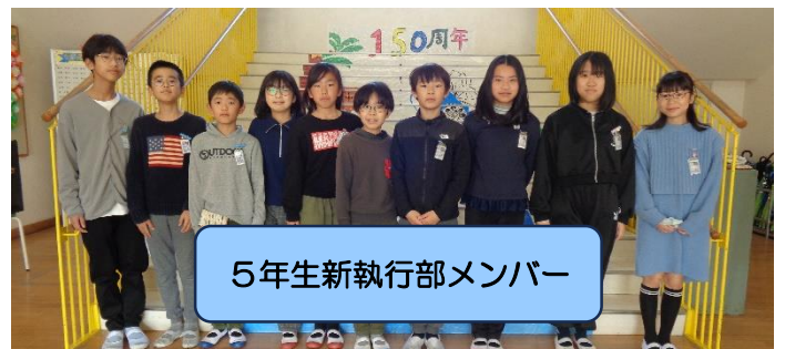
5年生新執行部メンバー