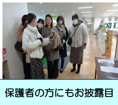
保護者の方にもお披露目