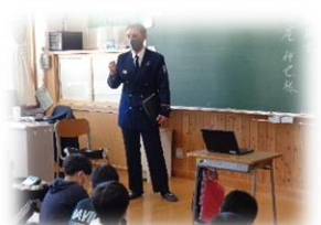
【児童の振り返りより】

6年生は今総合的な学習の時間に自分の将来に向けて自分の生き方や人生について考える「未来に向かって～志～」の学習を進めています。その中で看護師、花屋さんに勤務の方、研究関係者、消防士、空手指導者、助産師、通訳、ネイリストなど8名の様々な職業の方をゲストティーチャーとして迎え、お話をお聞きしました。仕事の内容、その仕事に就いた理由やきっかけ、苦勞や今まで乗り越えてきたこと、仕事をしての達成感や喜びなどのやりがいなどについてお話をいただきました。8名の方は、保護者や地域の皆さんです。子供たちはお話を聞く中で、ゲストティーチャーの生き方、大切にしてきた言葉や思いに触れることで自分の生き方を見つめ直す機会となり、良い経験をすることができました。お話を通して、自分を見つめ、描いた未来を志として卒業文集にまとめています。これからの生き方についてさらに自分の考えを深めていきます。