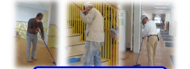
お掃除ボランティアさんによる 校舎内の掃除