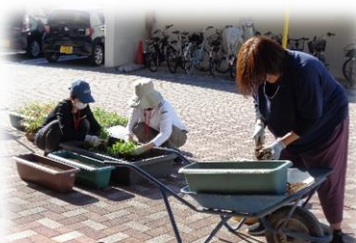
フラワーボランティアさんによる 花の植え替え