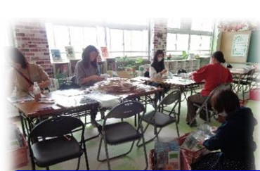
PTA本部役員さんによる 創立150周年の記念品袋詰