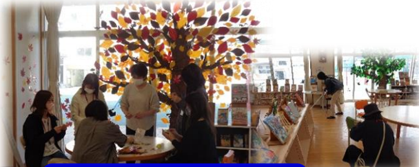
図書ボランティアさんによる 図書コーナーの整備

学校のために子供たちのために地域や保護者の皆さんにボランティア活動やPTA活動をいただいています。子供たちの学びを支えていただいています。ありがとうございます。