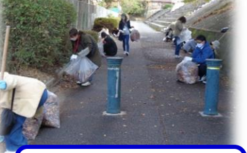
お掃除班さんによる 歩道などの掃除