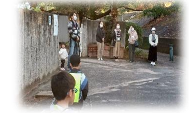
挨拶班さんによる さわやかあいさつ運動