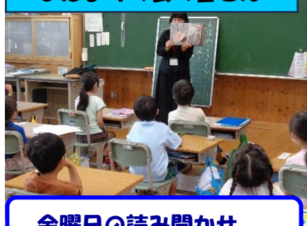
金曜日の読み聞かせ