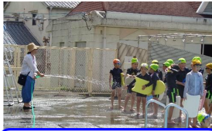
プールサイドへの水まき