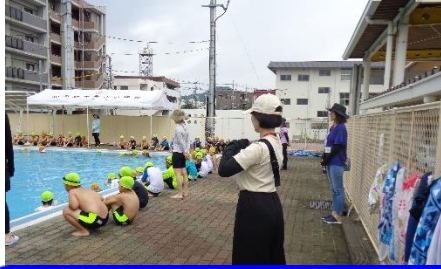
プールサイドからの見守り

本格的な水泳指導が再開しました。熱い日差しの中、多くの保護者の方がボランティアとして水泳や自習をしている子供たちの安全を見守ってくださいました。無事に水泳指導を終えることができました。