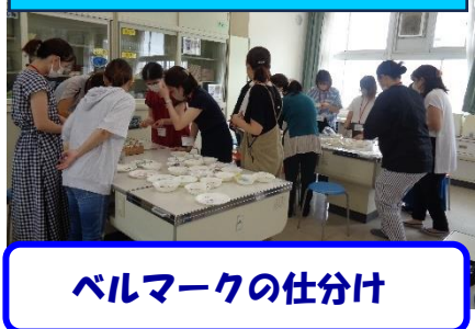
ベルマークの仕分け