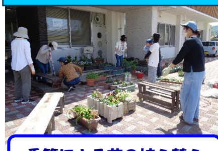
季節による花の植え替え