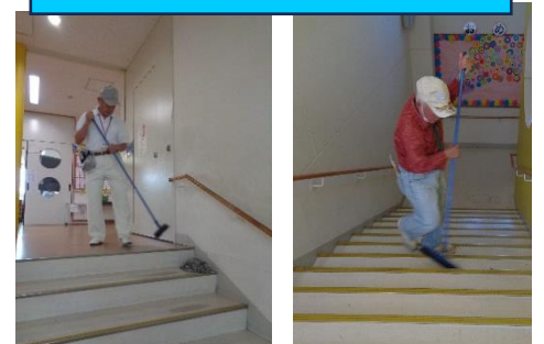
3人の地域の方が来られて毎週階段や廊下をきれいに掃除をしてくださいます。