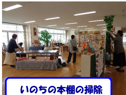
いのちの本棚の掃除