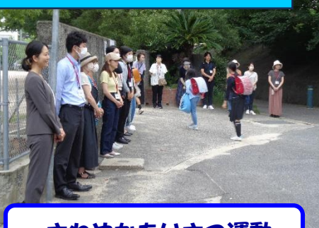
さわやかあいさつ運動