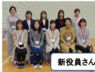
新役員さんよろしくお願いします