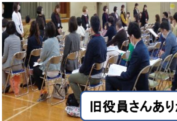
旧役員さんありがとうございました

生徒指導で大切にしたい4つの柱 ① 聞き名人をめざそう ② 進んであいさつをする ③ 時間を守る ④ 自分も友達も大切に