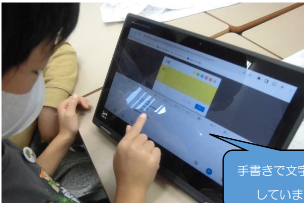
手書きで文字を入力しています。

ぐんぐんデーにむけて、夏休み明けから取り組んできた生活科の「まちのすてきをみつけよう」。図書館見学や学校の周りを探検することを通して見つけたことをワークシートやポスターにまとめてきました。A・B・Cコースを比較して気付いたことをもとに学習者用パソコンのジャムボードをつかってグループごとにまとめを行いました。地図に書き込みをしたり、付箋を書き加えたりして主体的に取り組む姿が見られました。2学期からジャムボードの練習を行ってきて、スムーズに操作ができるようになっていきます。