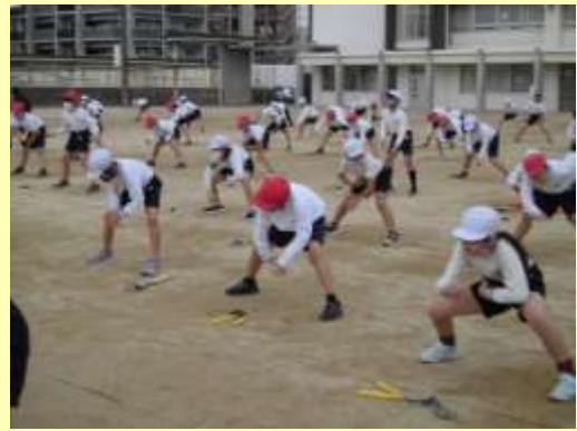
大きな網をぐるぐる巻く動きを力強く