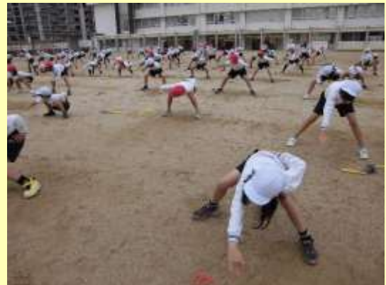
最後のポーズ。腰を落としてかっこよく