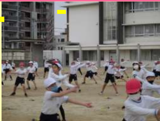
どっこいしょ〜どっこいしょ!足を深く曲げる

体育科の表現運動は「ソーラン」をしました。威勢のいい動きや掛け声は、元気な4年生のぴったりで。足を深く曲げたり、腰を低く落としてしたりする姿に、教師陣は完全に負けました。12月18日に全員で踊った時は、皆の心が一つになり、とても感動しました。