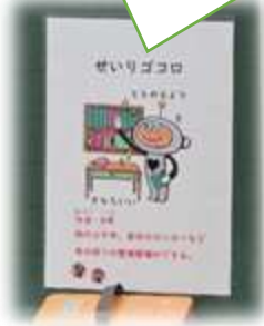
高学年は自分たちで次の日の予定を確認して、見通しを持ちます。