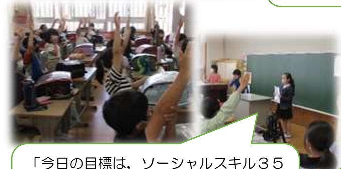
「今日の目標は、ソーシャルスキル35アイテムの中の『はげましバトン』でしたね。土曜日だけ声をかけあって頑張ることができた人は手を挙げましょう。」