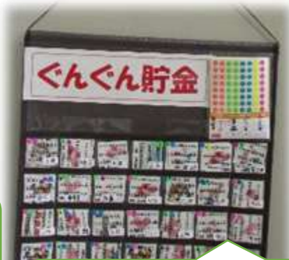
ぐんぐんカードを選んでやりたい自分を目指そう！