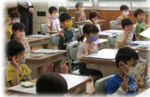
「はい、元気です！はてなOKです。」大きな声で言えた自分に自分でオッケーマークをあげている1年生。