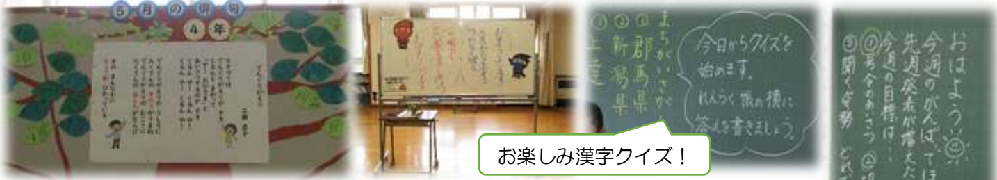
お楽しみ漢字クイズ！

朝の会は子供たちが「生きる希望」を見いだすことができるように、帰りの会は人として「賢くなったなあ」という実感を持つことができるように内容や言葉がけを工夫しています。朝も帰りも「学校に来てよかった」と子供たちが思えるように、これからも取組を積み重ねていきます。