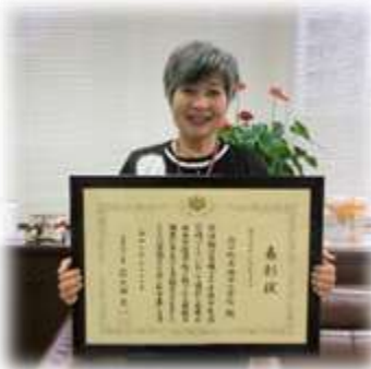
いただいた表彰状

新しい仲間を迎えた私たち府中小学校教職員は、期待に満ちた府小っ子に会えることをとても楽しみにして、環境整備や授業の準備、教職員としての力を付ける学びに励んでいました。