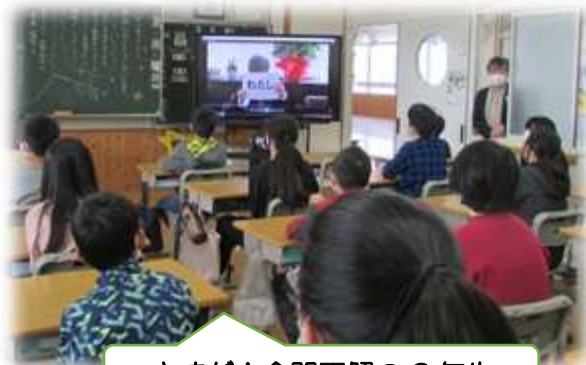
さすが！全問正解の6年生

さて、新年度のスタートにあたり、府小っ子の皆さんに私が願っていることについてのクイズをします。