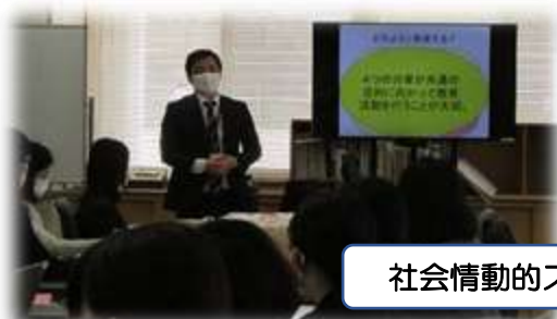
社会情動的スキル研修