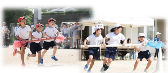
【3年】団体「Go! Go! タイフーン」