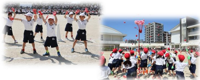
【1年】団体「ハッピー玉入れ」