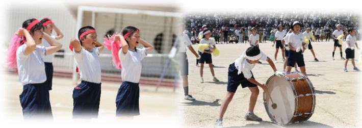
【5年】団体「上 show つなひき 〜力でぶつかあい、つかみとれ勝利の1本線〜」