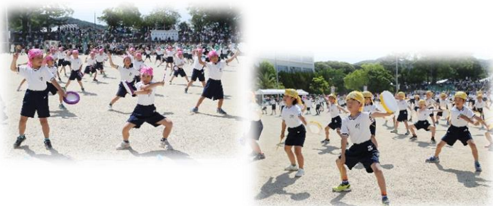
【2年】表現「エイサー〜心を一つに」